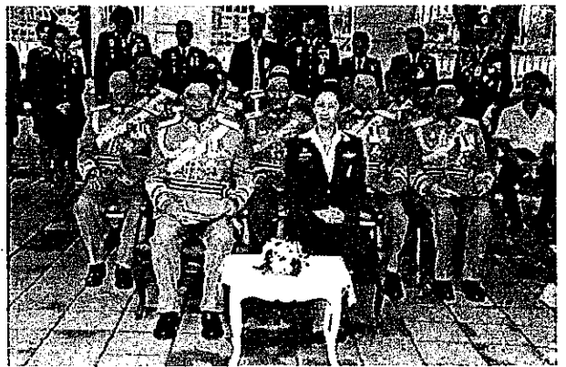
รูปแบบที่นั่ง ผบ.ตร.ประธานในพิธี ปี ๒๕๕๔ (ถูกต้อง)