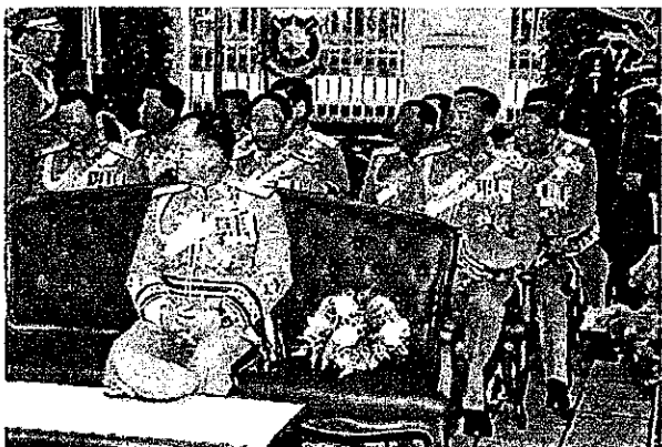
รูปแบบที่นั่ง ผบ.ตร.ประธานในพิธี ปี ๒๕๕๕ (ไม่ถูกต้อง)