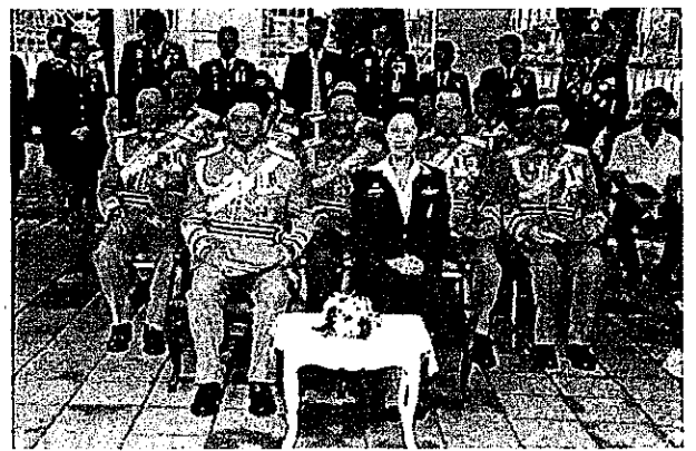
รูปแบบที่นั่ง สบ.ตร.ประธานในพิธี ปี ๒๕๕๔ (ถูกต้อง)