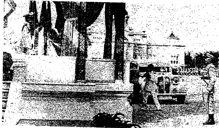
พิธีกล่าวคำสัตย์ปฏิญาณตนและสวนสนาม เมื่อวันที่ 13 ตุลาคม พ.ศ.2495 ณ ลานพระราชวังดุสิต (ภาพและข้อมูลจาก : วารสารตำรวจ ปีที่ 21 เล่มที่ 21, พฤศจิกายน 2495)

พิธีกล่าวคำสัตย์ปฏิญาณตนและสวนสนามของนักเรียนนายร้อยตำรวจ และหน่วยตำรวจต่าง ๆ ที่สำคัญและถือเป็นประวัติศาสตร์ อันเป็นสิริมงคลแก่ปวงชนชาวไทย ตำรวจอย่างยิ่ง เพราะด้วยพระมหากรุณาธิคุณแห่งองค์พระบาทสมเด็จพระเจ้าอยู่หัว ได้เสด็จพระราชดำเนินทรงเป็นองค์ประธาน ในการกล่าวคำสัตย์ปฏิญาณตน ทรงทอดพระเนตรการเดินสวนสนาม และทุกครั้งได้พระราชทานพระบรมราโชวาท ซึ่งนับเป็นพระมหากรุณาธิคุณอย่างสูงยิ่ง มี 3 ครั้ง ดังนี้ ครั้งที่ 1 เมื่อวันที่ 13 ตุลาคม พ.ศ.2495 ณ ลานพระราชวังดุสิต (ลานพระบรมรูปทรงม้า) ในครั้งนั้นพระบาทสมเด็จพระเจ้าอยู่หัว เสด็จพระราชดำเนินเป็นองค์ประธาน ได้พระราชทานธงชัยประจำหน่วยโรงเรียนนายร้อยตำรวจ และหน่วยตำรวจรวม 6 หน่วย มีพิธีกล่าวคำสัตย์ปฏิญาณตนและสวนสนาม พระบาทสมเด็จพระเจ้าอยู่หัวทรงทอดพระเนตรการเดินสวนสนามของหน่วยตำรวจ ทรงพระราชทานพระบรมราโชวาท และมีพระราชกระแสรับสั่งผ่านทางกรมราชองครักษ์ ชมเชยการสวนสนามของหน่วยตำรวจ (หนังสือกรมราชองครักษ์ที่ 630/2495 ลงวันที่ 14 ตุลาคม พ.ศ.2495) ถึง อธิบดีกรมตำรวจ ความตอนหนึ่งว่า..... ได้ทอดพระเนตรเห็นการสวนสนาม ได้กระทำไปด้วยความเข้มแข็งองอาจ และพร้อมเพรียงดียิ่ง น่ายชมเชยฯ