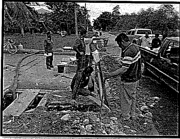
ภาพประกอบ งานวางท่อประปาภายใน รร.นรต.