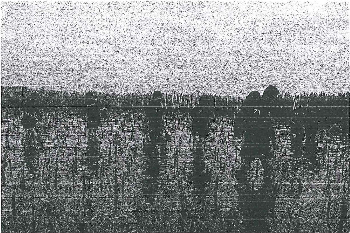
ข้าราชการตำรวจ คณาจารย์ และนักเรียนนายร้อยตำรวจร่วมกันลงพื้นที่ปลูกรักษ์กล้าไม้ จำนวน ๓๐๐ ต้น เพื่อเพิ่มแนวป้องกันทางธรรมชาติ