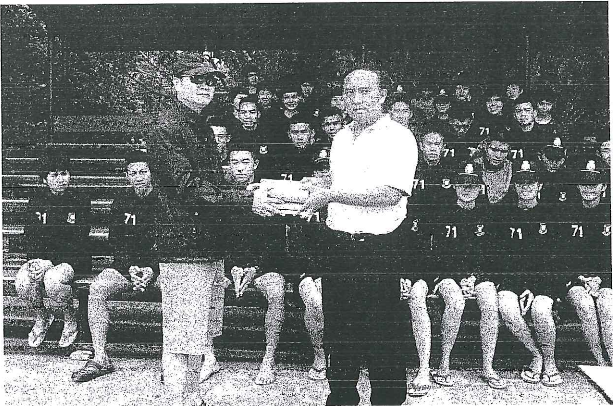
คณาจารย์ได้มอบหนังสือและของที่ระลึก แก่ ผอ.กองสถานพักผ่อน กรมพลศึกษาทหารบก