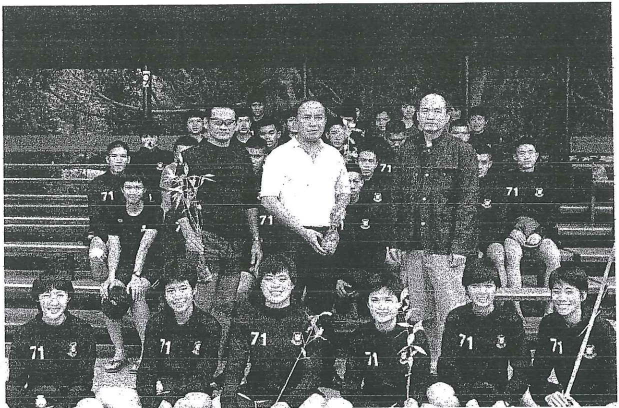
ข้าราชการตำรวจ คณาจารย์ และนักเรียนนายร้อยตำรวจ เดินทางไปร่วมโครงการปลูกป่าชายเลนเพื่อเพิ่มพื้นที่แนวป้องกันทางธรรมชาติ ณ ศูนย์ศึกษาธรรมชาติ สถานตากอากาศบางปู กองอำนวยการสถานพักผ่อนกรมพลธิการทหารบก อำเภอมะนังสมุทรปราการ จังหวัดสมุทรปราการ เมื่อวันที่ 13 ธันวาคม 2557