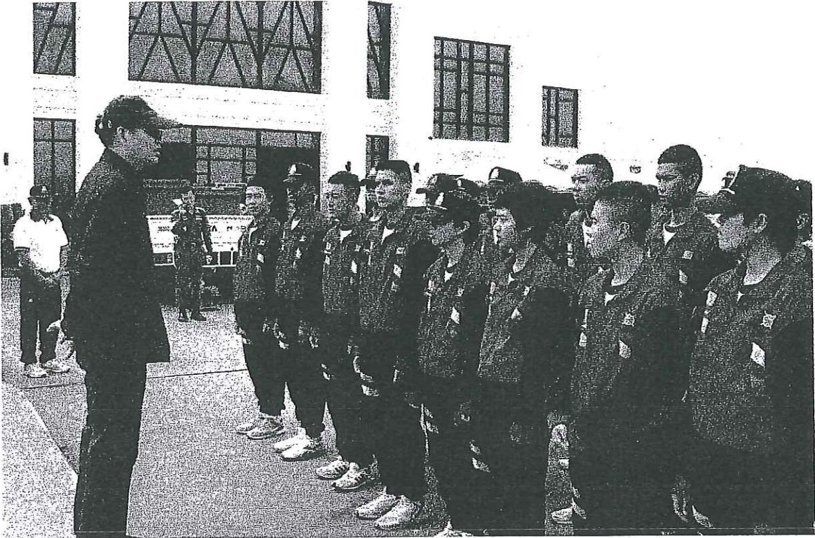
ข้าราชการตำรวจ คณาจารย์ และนักเรียนนายร้อยตำรวจเดินทางถึงศูนย์ศึกษาระดมชาติ สถานตากอากาศ บางปูฯ โดย สวป.สภ.บางปู ตำรวจภูธร จ.สมุทรปราการ ให้การต้อนรับ